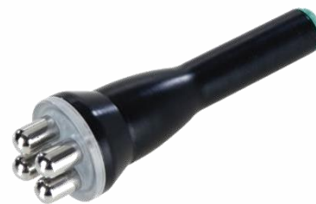
ZONES MOYENNES: 4 PÔLES