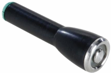
PETITES ZONES: 2 PÔLES