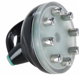
GRANDES ZONES: 8 PÔLES